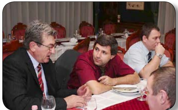
A tapasztalat segít