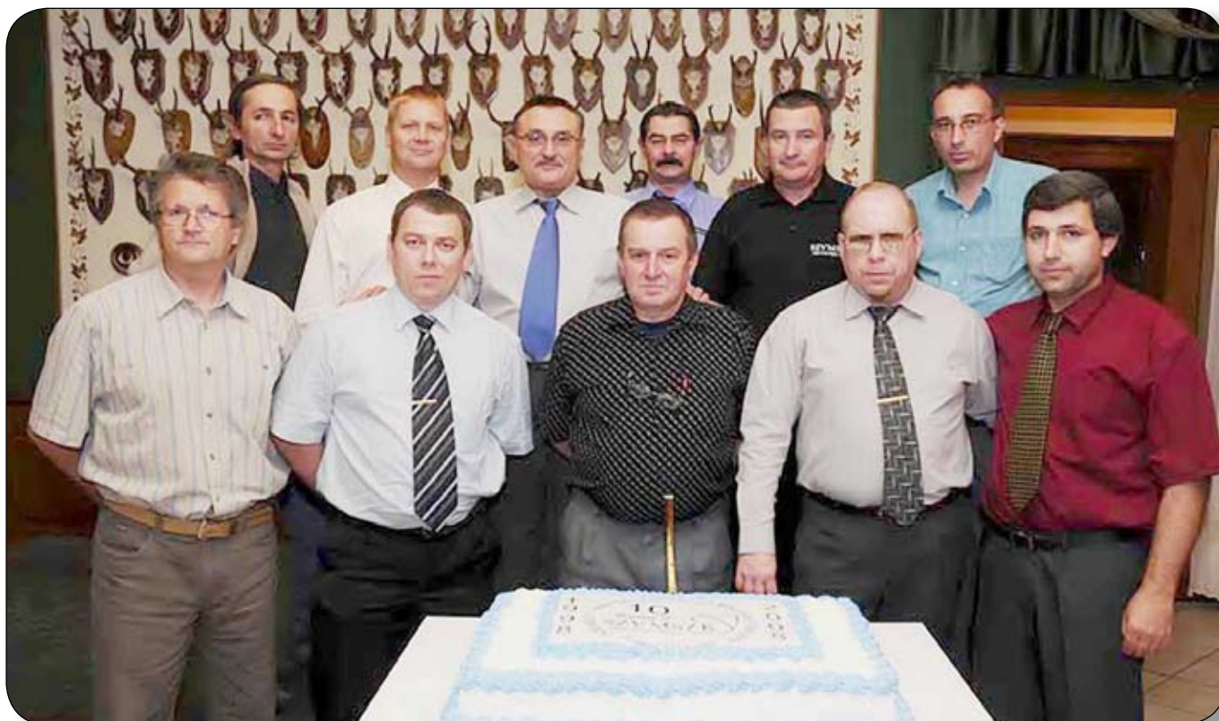
Néhányan az alapítók közül. Közös fotózás a tortával