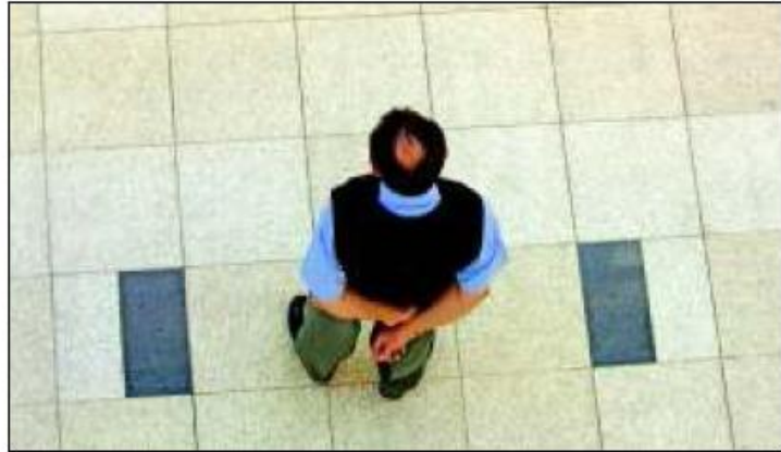
Fokozott jogi védelmet kérek.

A fokozott jogi védelemtől a kamara egyfelől azt reméli, hogy kevesebb inzultus éri a vagyonőröket, másfelől viszont a szakmai színvonal javulására is számítanak. Németh Ferenc szerint a gazdasági válság hatására a megbízók már ma is jobban megnézik, hogy mire bízák vagyonuk, dolgozóik biztonságát. Mivel a kamara nem kér